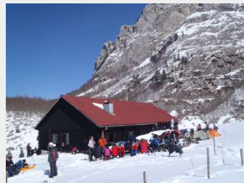
Uživamo na suncu

Karaulu smo, nažalost, zatekli u još gore stanju nego što je bila prošle godine – potpuno zapuštena, prljava, sa nesnosnim mirisima koji su se širili na sve strane. Pokušali smo malo da je očistimo, postavili smo folije na podove i rasporedili se po prostorijama. Bilo je planinara koji su poneli i šatore, pa su ih vrlo brzo podigli pored karaule. Oko pola tri popodne, nas dvadesetak krenuli smo kroz šumu, da isprimo stazu do graničnog kamena, kako bismo olakšali kretanje grupe, kada u toku noći budemo krenuli na uspon.