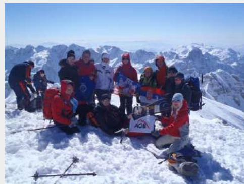
Deo grupe na vrhu