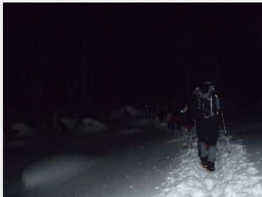
Polazak u noć